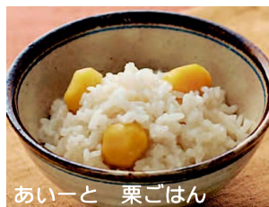
あいーと 栗ごはん