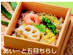
あいーと五目ちらし